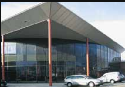
Gamma bouwmarkt, Hoogeveen